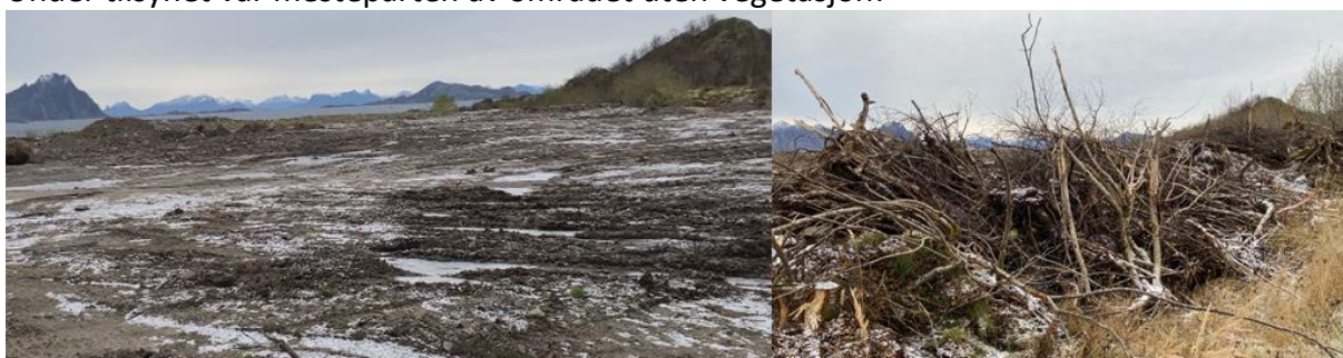
Figur 3: Område på deponiet uten vegetasjon. Trær var felt og røtter og kvister lå deponert på rekke øverst på deponiet.

Under tilsynet var mesteparten av området uten vegetasjon: