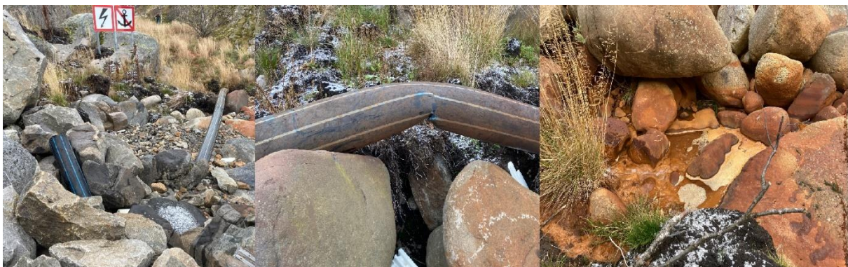
Figur 10: Avbildet er muligens sivevannsledningen uten synlig utslippspunkt, den er bøyd knekt i hvert fall på ett punkt. Flere områder i fjæra var tydelig påvirket av sivevannet.

I vilkår 3 til godkjenningen av avslutningsplanen for Osan er det stilt krav om at sivevannet fra deponiet skal legges i rør og dykkes under laveste lavvann. Under tilsynet fikk vi opplyst om at det har vært store utfordringer med at utslippsledningen har blitt revet løs og knekt opp mot land. Vi kunne under tilsynet ikke se hvor utslippspunktet var, og det var noe usikkert om ledningen på bildet under var sivevannsledningen, den var i hvert fall bøyd og brukket, og det kunne se ut som enden av den var under et lass med sprengstein og ikke under laveste lavvann. Vi ber dere undersøke og redegjøre for dette, se punkt 3 i dette brevet.