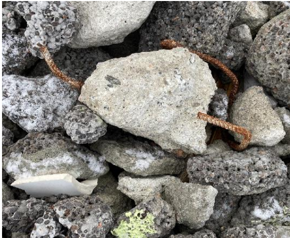
Figur 5: Det var en del armering og annet søppel iblandet lettklinkene og betongen

Mot nord, muligens noe utenfor selve deponiområdet var det dumpet ny og gammel asfalt: