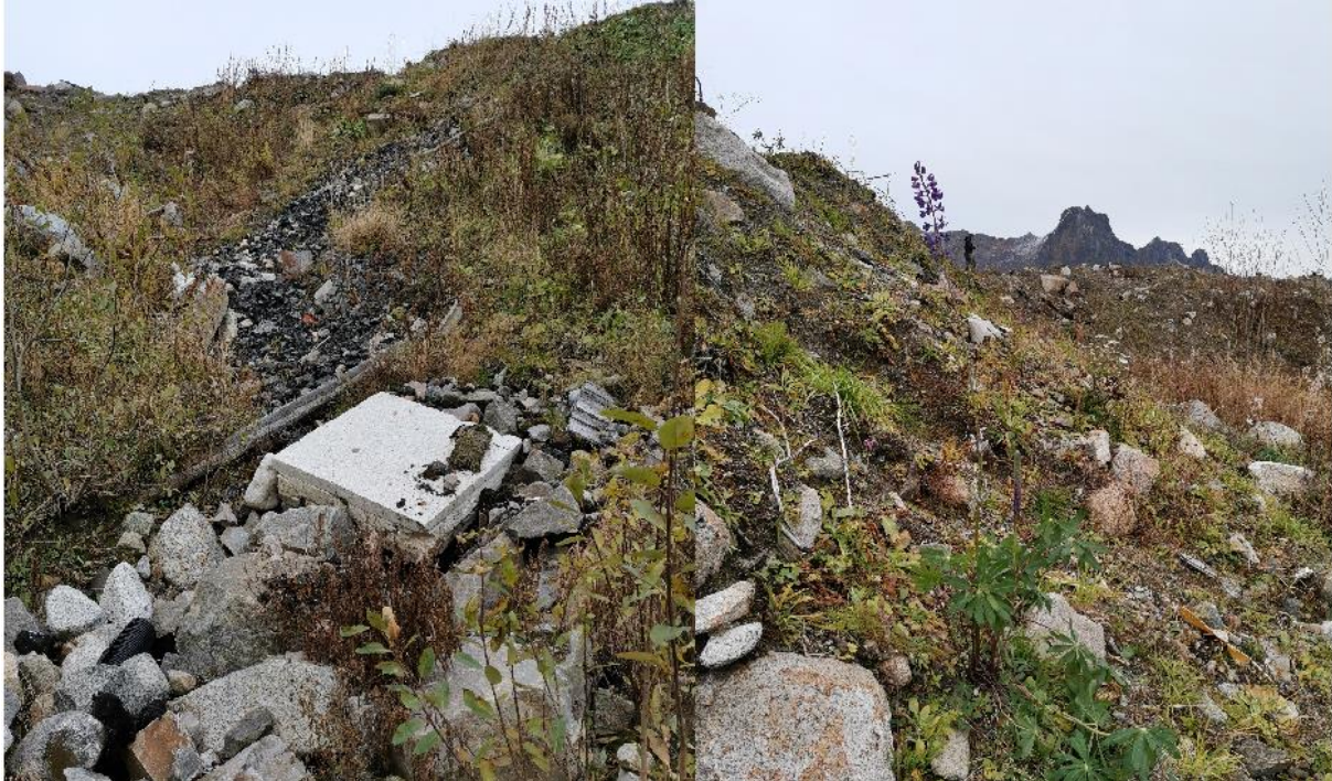
Figur 8: Skråningen ned mot fjæra, her er det tømt avfall og noen lupiner vokser i skråninga.

I skråningene var det også flere steder med lite tegn til etablert vegetasjon, og noe avfall som kan være tilført nylig. Vi fant også noen få lupiner i skråning ned mot fjæra, noe som tyder på at masser er tilført i løpet av de siste 1-2 årene siden lupiner etablerer seg og tar over et område i stor fart: