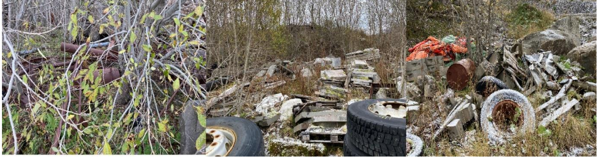
Figur 11: Eksempler på annen forsøpling på området

Som nevnt under avvik 3 er det omfattende forsøpling på og ovenfor deponiet, rundt området der kommunens driftsavdeling lagrer utstyr. Uansett hvem som er ansvarlig for dette er kommunen forsøplingsmyndighet, og vi ber kommunen ordne opp i saken.