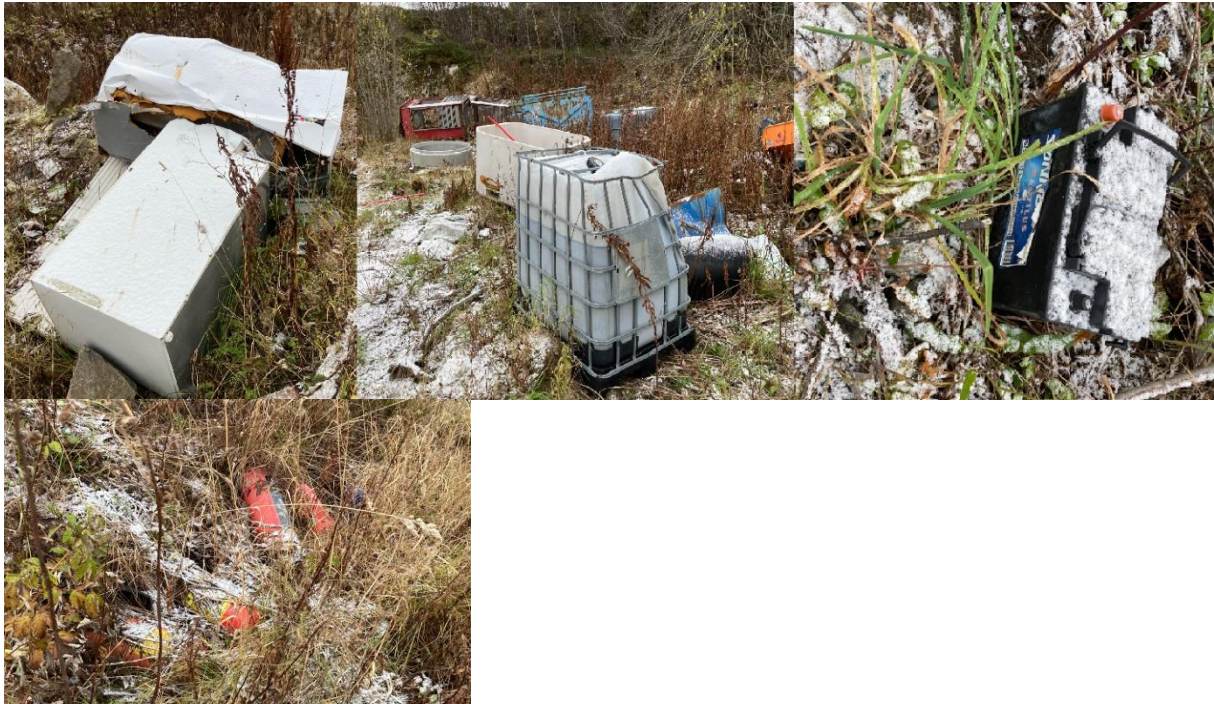
Figur 9: Kuldemøbler og farlig avfall: spillolje, batteri og brannslukningsapparat

forsøplingsmyndighet, og Statsforvalteren anmoder kommunen om å ta tak i dette. Når det gjelder bedrifters lagring av farlig avfall har Statsforvalteren også myndighet til å pålegge tiltak, jf. avfallsforskriften § 11-16 tredje ledd.