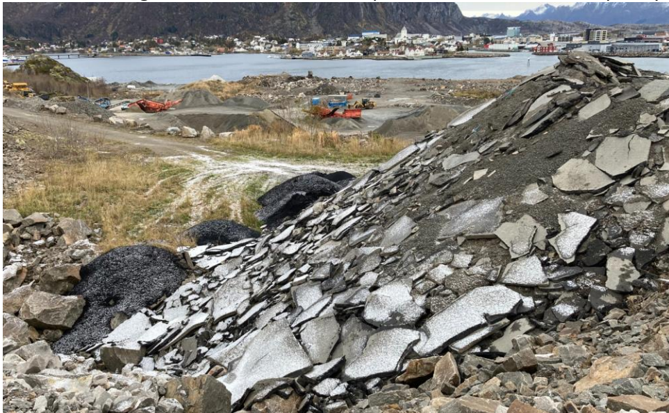
Figur 6: Asfalt

Mot nord, muligens noe utenfor selve deponiområdet var det dumpet ny og gammel asfalt: