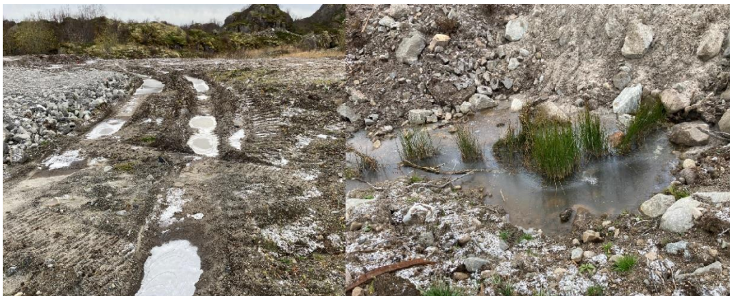
Figur 7: Groper som samler overvann oppå deponiet

Det var spor etter kjøring med tunge kjøretøy på området, og det var noen dypere groper som samlet overvann: