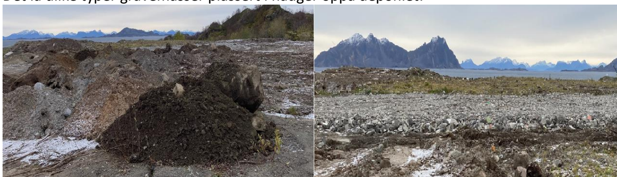
Figur 4: Område på deponiet med hauger av ulike gravemasser, ett område med betong og lettklinker

Det lå ulike typer gravemasser plassert i hauger oppå deponiet: