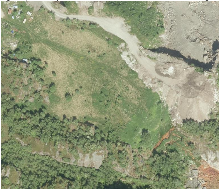
Figur 1: Utklipp fra Nordlandsatlas.no flyfoto fra 2017

I siste statusrapportering fra Lofoten Avfallsselskap til oss i 2009 ble det informert om at deponiet ble endelig avsluttet med toppdekke i 2005. På flyfoto fra Nordlandsatlas.no (2017, figur 1), ser deponiområdet ut som det er tildekket, og med en del vegetasjon.