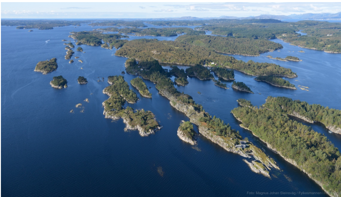
Lurefjorden og Lindåsosane er eitt av dei mest spesielle marine økosystema vi har, og områda er godt undersøkte. Norske marinbiologar har prioritert forskning i dette området, og med åra har dei produsert om lag 50 publikasjonar, 7 doktorgrader og over 33 masteroppgåver. Dermed er det ikkje berre sildestamma i Lindåsosane vi veit mykje om, men også om plankton, krepsdyr, kronemanetar og ikkje minst om vasskvalitet. Biletet er teke 21. september 2012.

Forsøpling vert forbode i eit marint verneområde, men dette kan sjølvsagt ikkje hindre at mykje plast og anna søppel vil drive inn med havstraumane utanfrå. Marin forsøpling er eit omfattande miljøproblem, ikkje berre estetisk, men også for dyrelivet i havet. Oppryddingsaksjonar er ofte krevjande å organisere og vanskelege å finansiere. I norske naturvernområde — også i marine verneområde — vil ein kunne nytte ein spesiell tiltakspost over statsbudsjettet til slike føremål. Norsk natur skal ikkje berre vere naturleg, den skal også vere tiltalande.