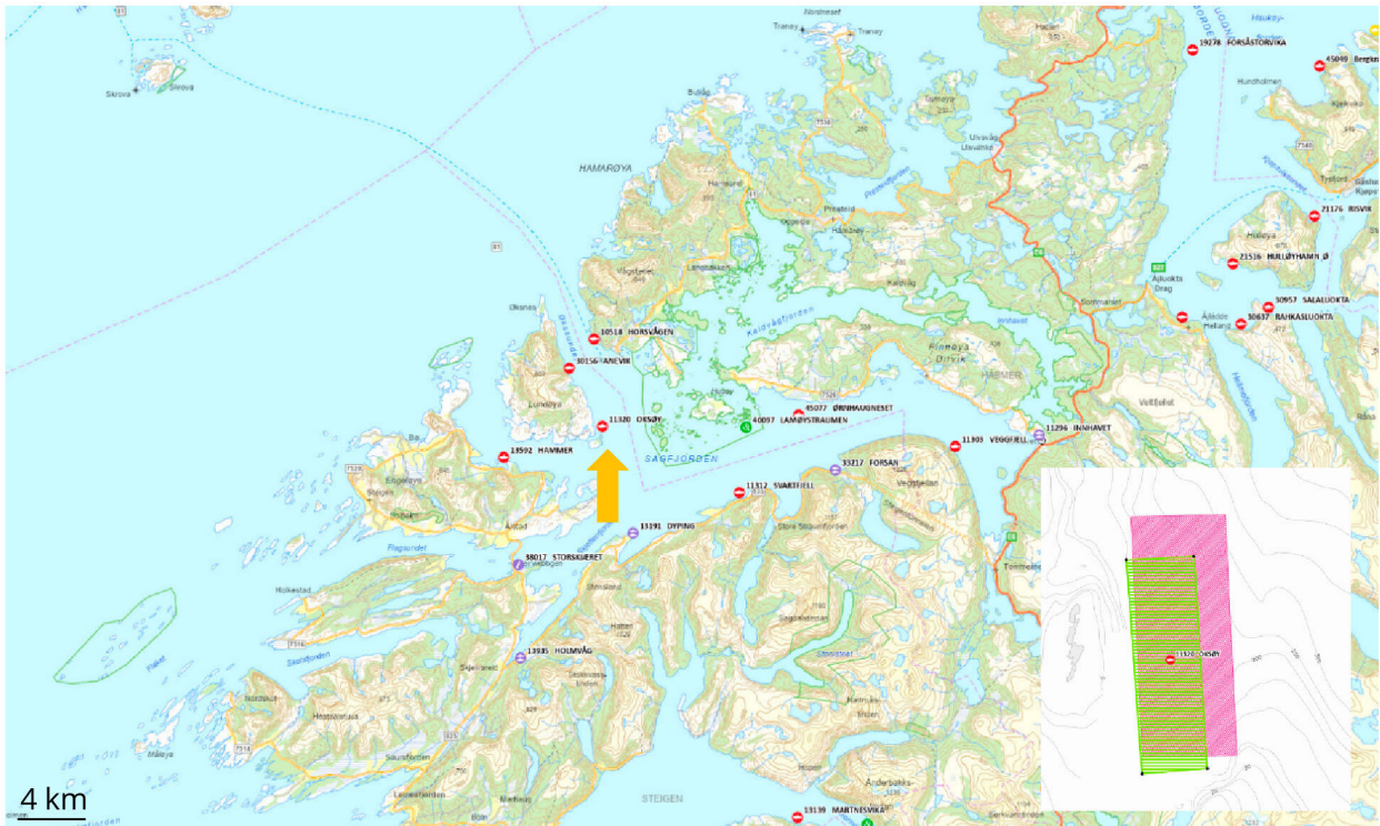
Figur 1. Lokalitet Oksøy (pil) ligger på vestsiden av Økssundet. Cermaq har totalt tre lokaliteter i Økssundet: Anevik (nord for Oksøy) og Horsvågen (på østsiden av sundet). Bildeutsnittet nederst til høyre viser avvik mellom arealet iht. akvakulturregisteret (grønn) og faktisk arealbruk (rosa). Kart fra Fiskeridirektoratets kartløsning 9