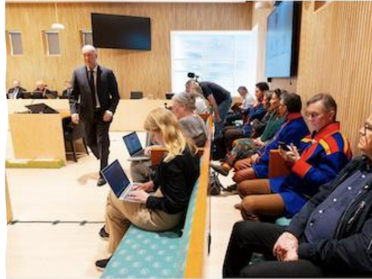
DMVATTENDE SAK: Rettens medlemmer, et stort oppbud av advokater, journalister og tilhørere var på plass da saken startet i Høylandet tinghus. Nå er det uklart hvordan framdrifta i saken blir.