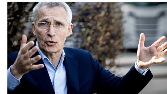
FINANSMINISTEREN: Jens Stoltenberg forklarte i mars hva hensikten bak kommisjonen er. Den skal følge opp enigheten mellom Arbeiderpartiet...

Norge har fått en regjeringsoppnevnt omstillingskomisjon . Det lyder nesten teknokratisk uskyldig - men spørsmålet er alt annet enn ufarlig: Hva er det egentlig Norge skal omstilles fra? Og hva skal vi bli?