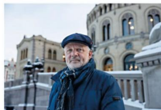
Forsoningskommisjonen leverte sin rapport til Stortinget 1. juni 2023.

Sannhets- og forsoningskommisjonen som har gransket forforskning og urett mot samer, kvener/norskinner og skogfiner og leverte i dag sin rapport til Stortinget. Vi foreslår fem grep for et mer forsonet samfunn.