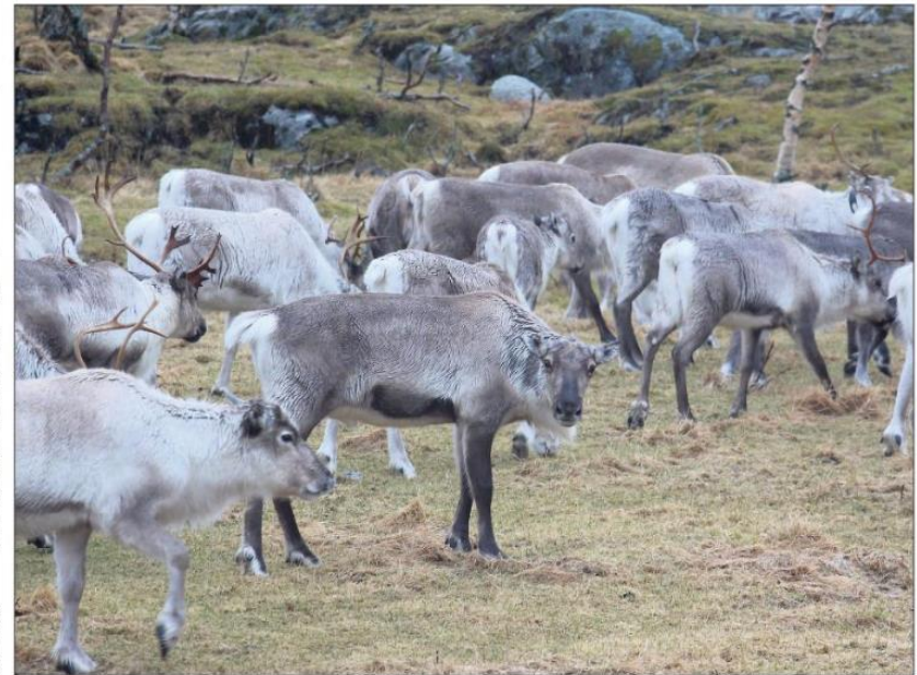
INSTINKT: Reinen finner instinktivt veien til de områdene der de selv ble født når de selv skal kalve. Fraktes de derimot med lastebiler, vet de ikke lenger ikke hvor de er.

er rein i området en driver dere egentlig med i disse fjellene? Mange me- ter. Ja, jeg hører det. Men det alltid vært rein der, men rik- ok ikke så hyppig de seine- rene. Vi har hittil hatt mye i områdene rundt Brønn-