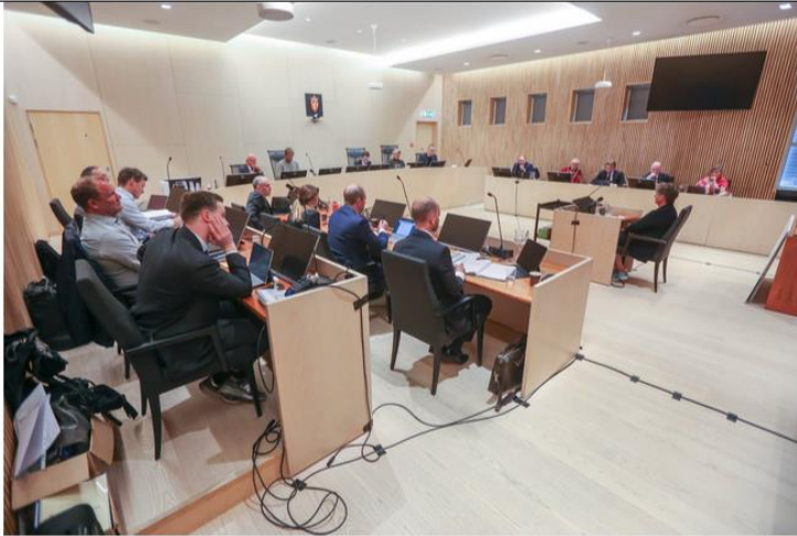
KRITISERER MEDIA: Innleggssforfatterne kommenterer mediadekningen av skjønnsaken som Øyfjellet Wind har anlagt mot Jillen Njaarke reinbeitedistrikt.