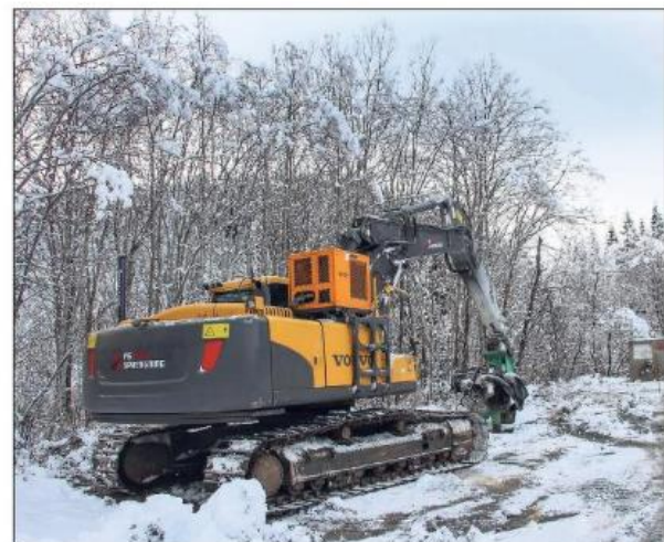
FORSETTER JOBBEN: Anleggsarbeidet i Tverrådsveien startet i november, og vil fortsette med full styrke i tiden framover, også i jula.

- Dersom reinemeierne mister tilgangen på et viktig vinterbeiteområde, vil det ikke være nok