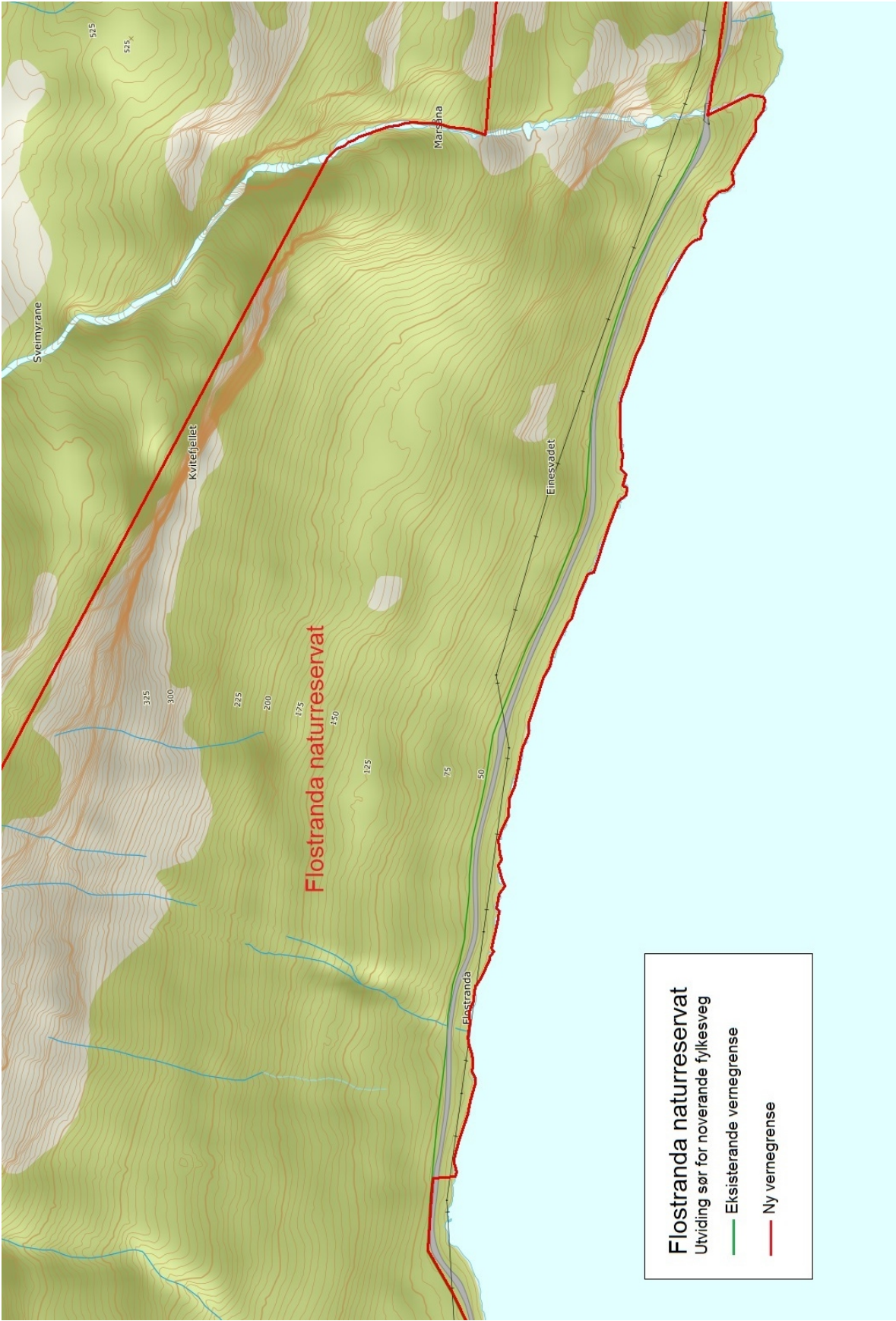
Vedlegg 1. Flostranda naturreservat – kart over utvidingsområde