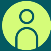
Tilgang på formell helsefaglig kompetanse