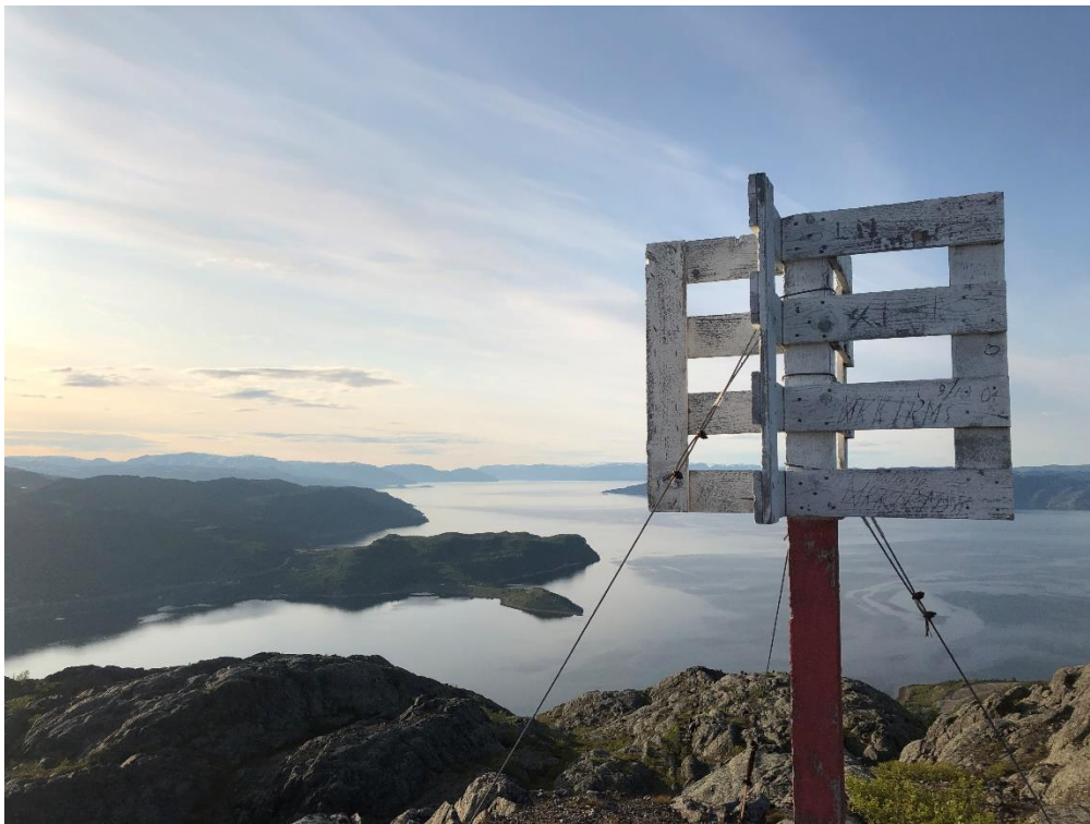
Utsikt fra Nordtoppen i Alta