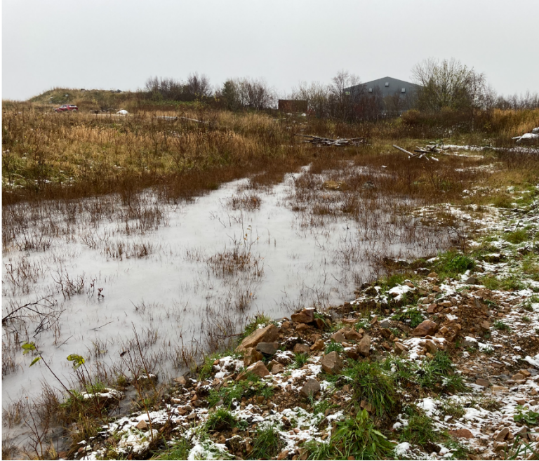
Figur 2: Samling av overvann, muligens noe sivevann i overkant av deponiet

Under tilsynet var det vått i marka og en del overvann, muligens noe sivevann jf. figur 3, hadde samlet seg i overkant av deponiet. Kommunen burde vurdere behov for vedlikehold av grøfting rundt deponiet for å avskjære overvann og mer effektivt lede dette bort.