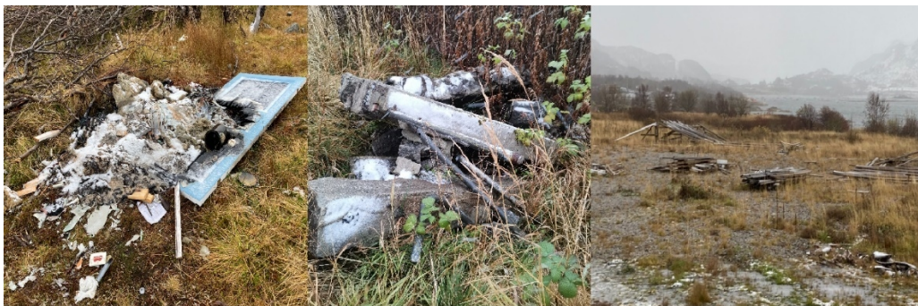
Figur 1: Bildene viser et søppelbål og noe hensatt skrot og materiale som kan være avfall

Under tilsynet var det noe forsøpling på området, og tydelige rester etter søppelbål. Kommunen er myndighet for både forsøpling og åpen brenning etter forurensningsloven, og som grunneier kan/bør dere også vurdere andre tiltak som kan motvirke at deponiområdet tiltrekker seg denne typen ulovlige aktiviteter.