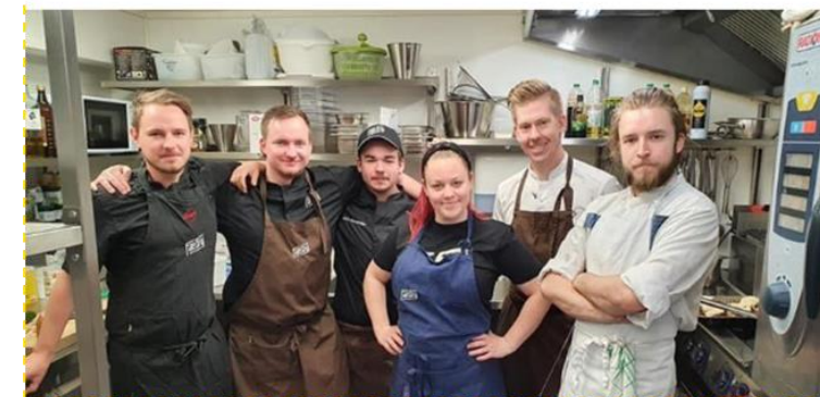
Fæby Bryggeri. Foto Jørund H. Eggen