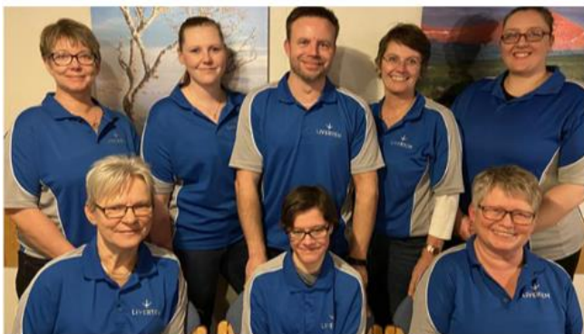
Staben på LIVERTEN i Lierne har hatt bedriftsintern kompetanseheving.

– Viktig for oss som faller mellom to stoler