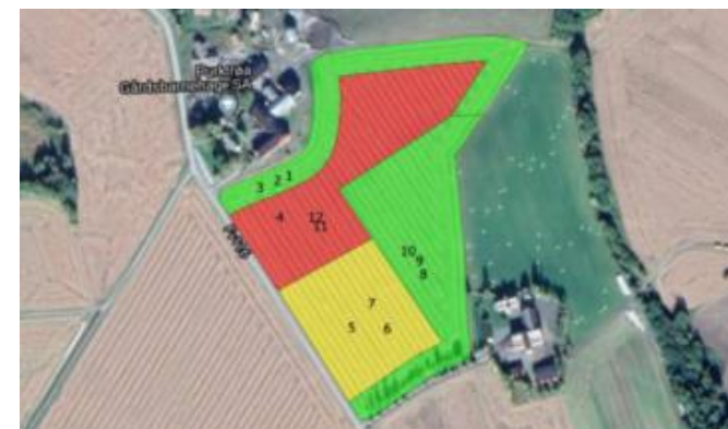
Sonekart for variabel tildeling av korn og gjødsel.

Organisasjoner, institusjoner, kommuner og ulike former for samarbeidsorganer