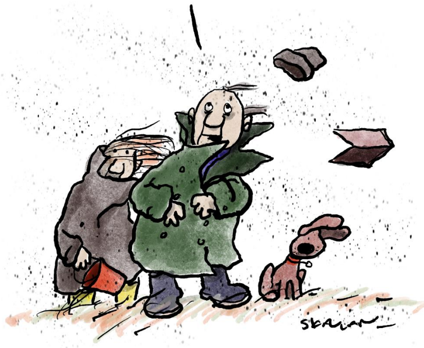
Figur 1 III: Fredrik Skavlan

Det verste er ikke at de fyller kjellerne våre med vann og river takene av husene våre. Det verste er at vi liksom skal være på fornavn med dem i tillegg!