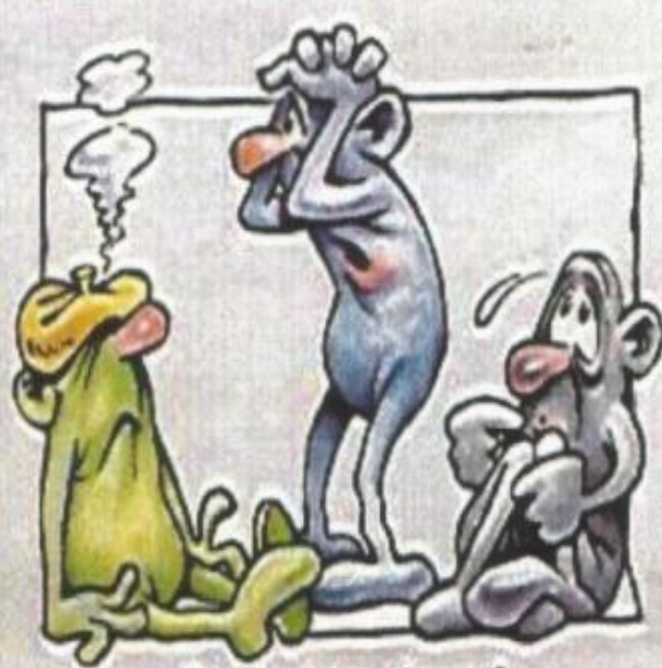
3. Dagen derpå