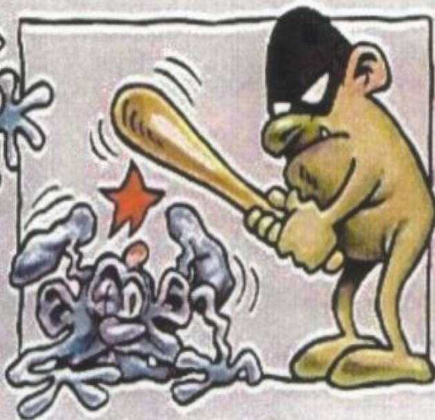
5. Avstraffelse av de skyldige