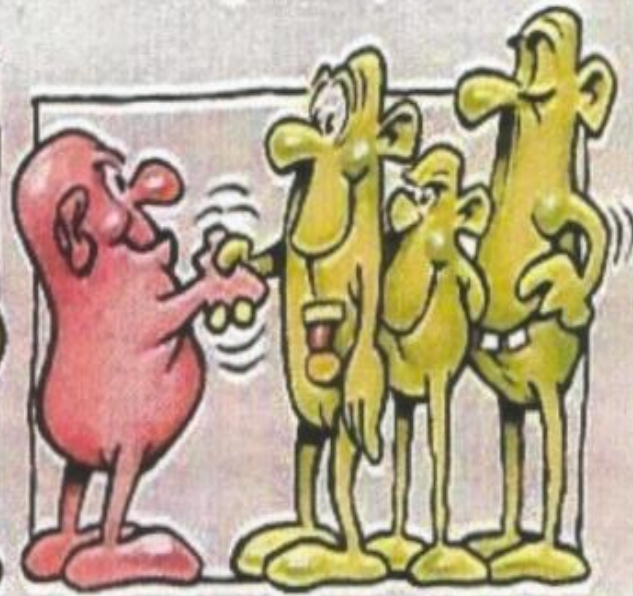
6. Belønning av de som ikke deltok