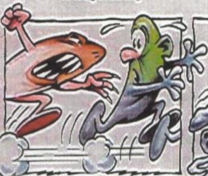
4. Jakt på de skyldige