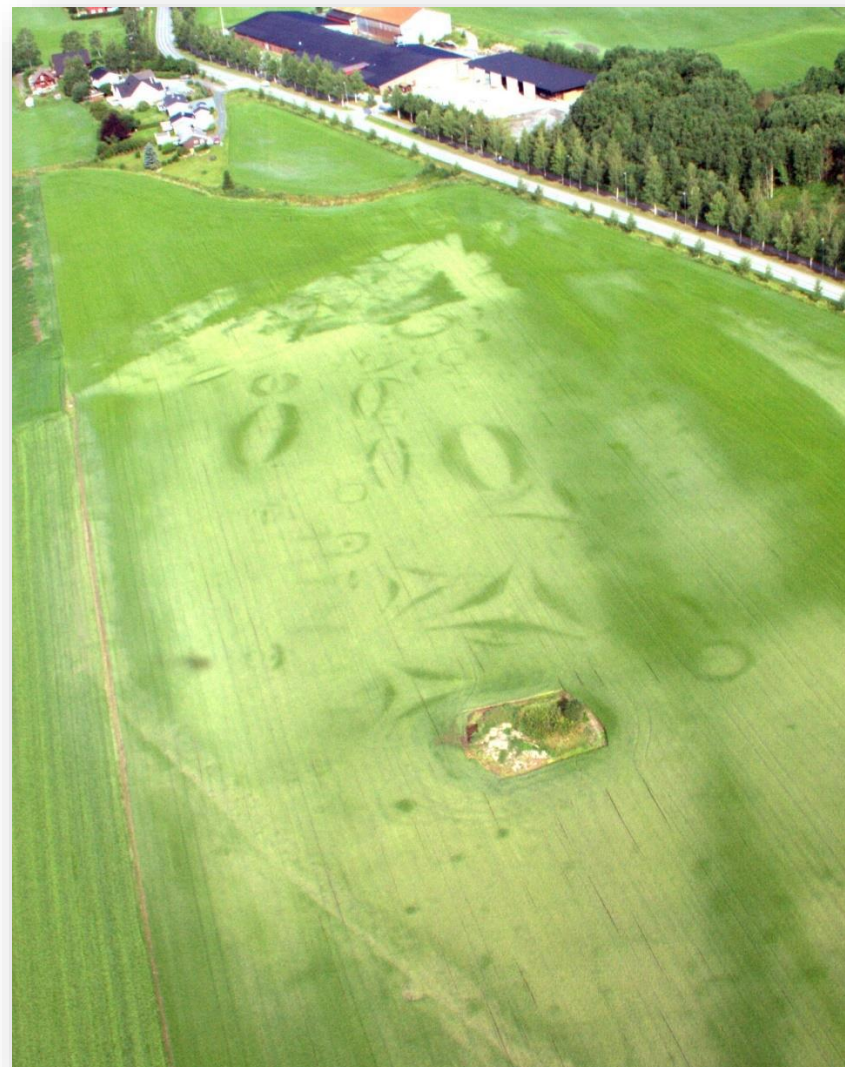
Bilde viser gravfelt under dyrket mark på Stiklestad.

Verneforskrifter (ved dispensasjon både fra vernevedtak og bestemmelser i eller i medhold av pbl., må vedtak i hovedsak først fattes etter verneforskriften, jf. nml. § 48.