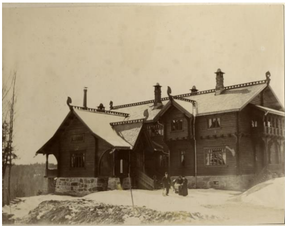
Dragestilvillaen, 1898.