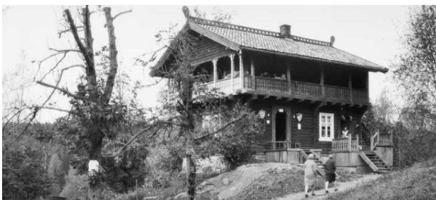
Kuskeboligen, 1928.

Ved Sarabråten ble det arrangert hopprenn som ble kjent som Sarabråtrennet eller Østkantens Holmenkollrenn. Ved Hauktjern rett øst for Sarabråten ble landets første speidertropp startet i 1910, og her ble det satt opp et minnesmerke for dette i 1955. På tunet på Sarabråten ble det rett etter krigen satt opp et minnesmerke over Milorg-karere som falt under krigen.